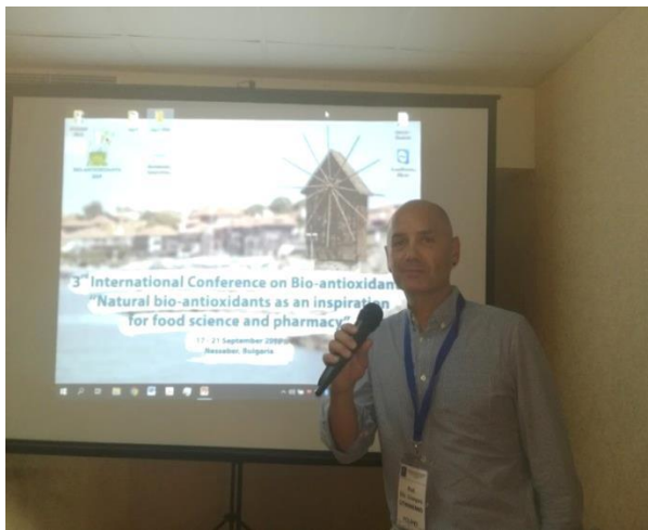
Проф. Литвиниенко от Университета във Варшава, Полша с Пленарна лекция за откриване на конференцията