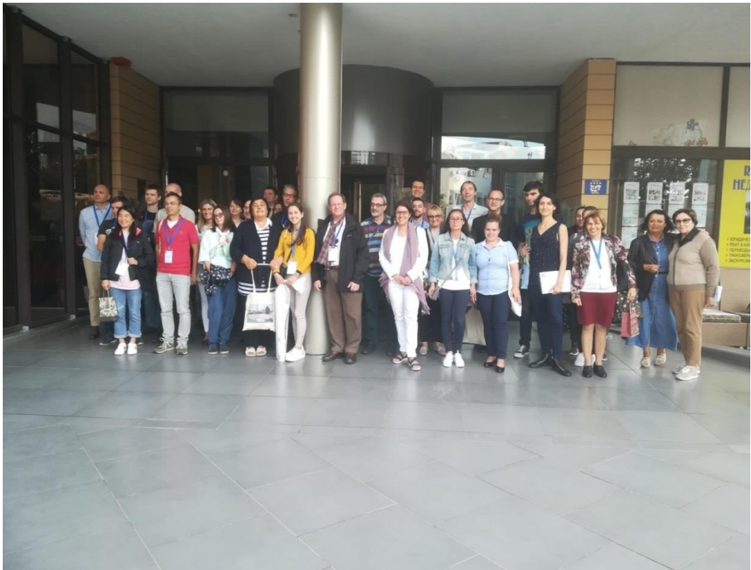
Групова снимка след закриване на конференцията