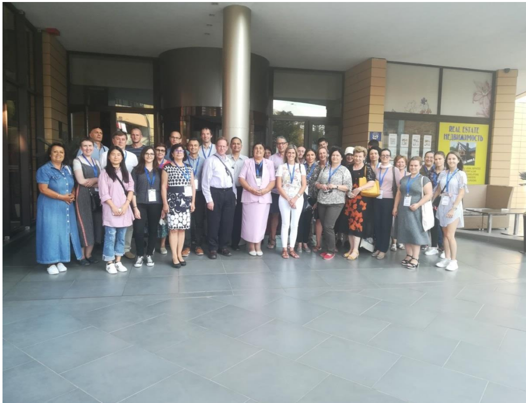
Групова снимка след откриването на конференцията