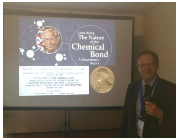
Проф. Ян Фред Стивънс от Университета на Орегон, САЩ с ключова лекция в направление „Оксидативен стрес“