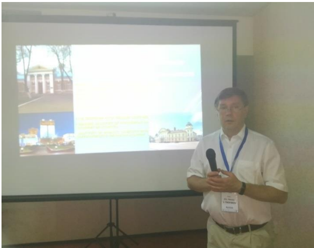
Проф. Алексей Трофимов от Руската академия на науките с ключова лекция в направление „Синтетични аналози на природни био-антиоксиданти“