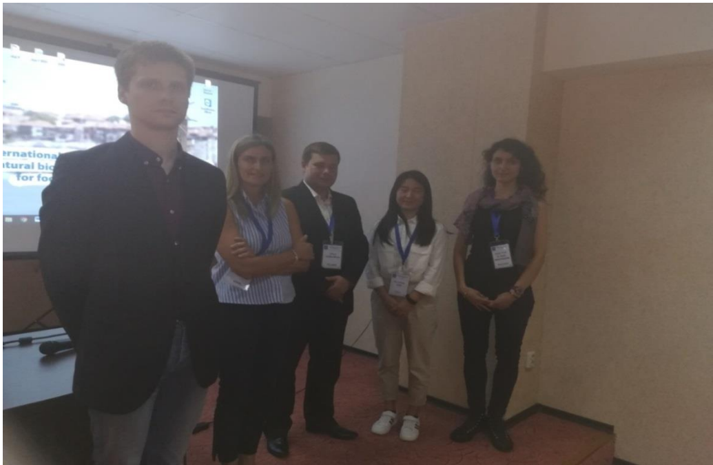
Млади учени с устни доклади на Младежката школа по био-антиоксиданти 2019