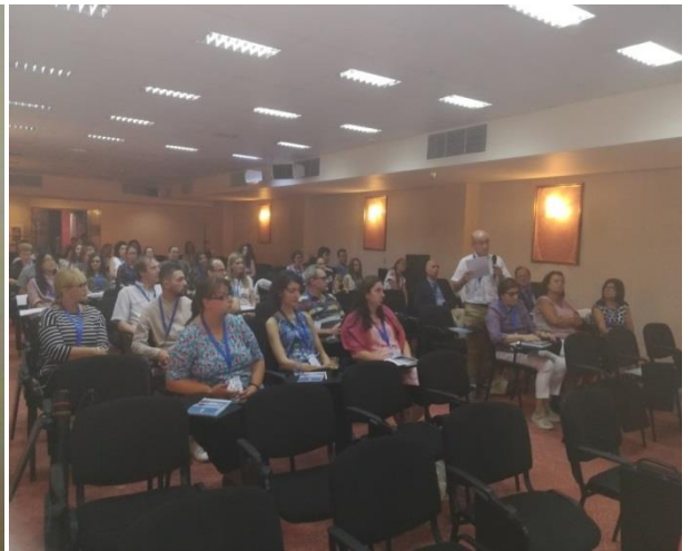
Проф. Сантиаго Аубург от Испания със заключителна пленарна лекция - тук обсъжда доклада